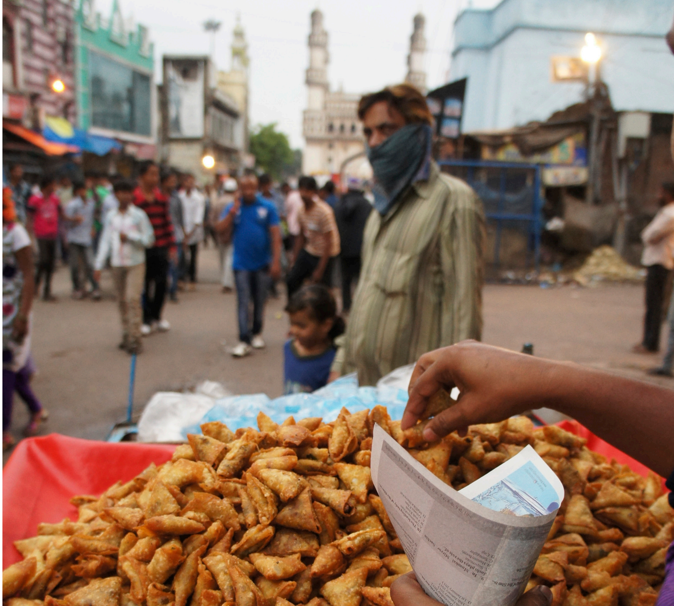
صور المدينة القديمة - حيدر آباد، الهند