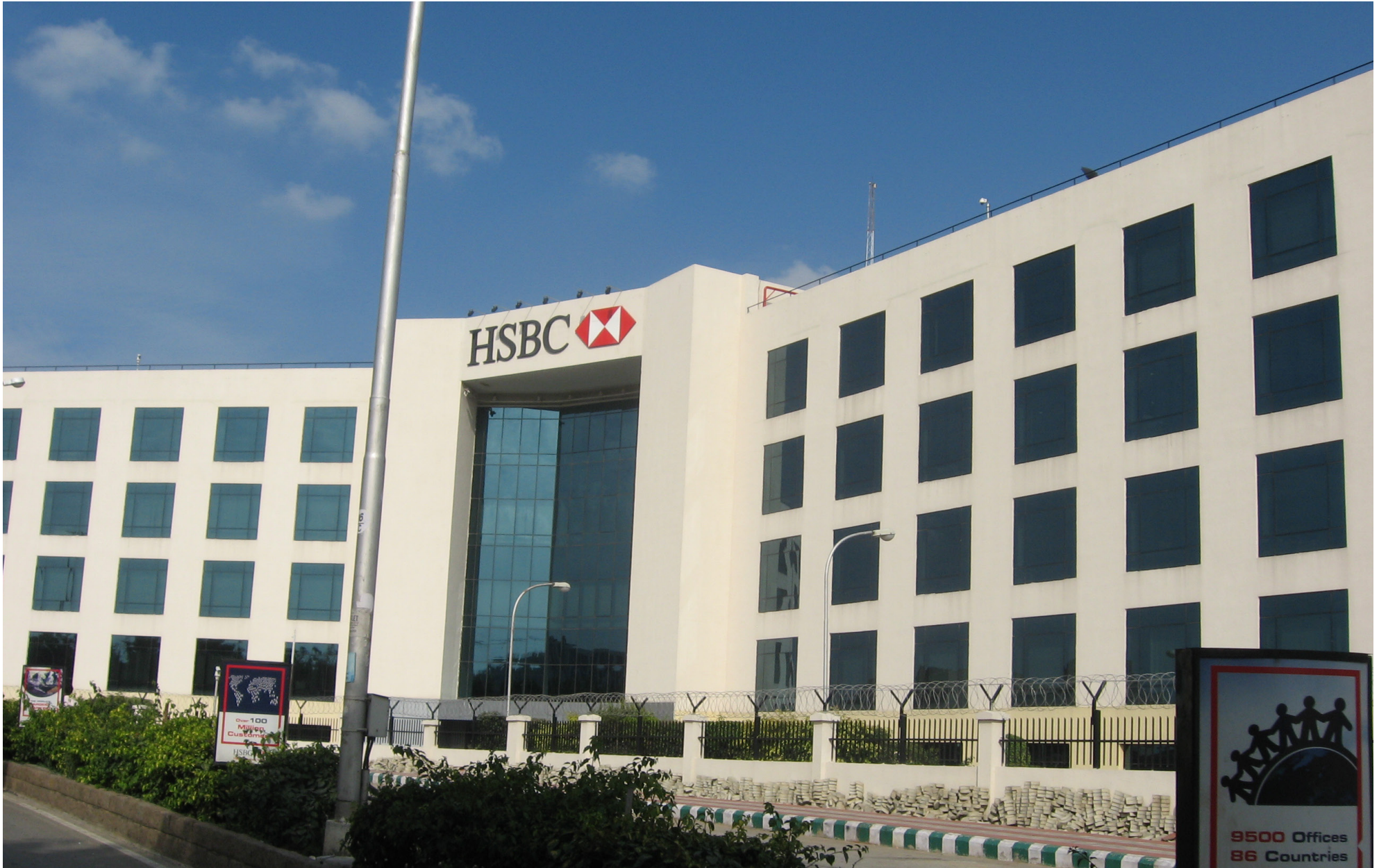
مكتب بنك HSBC في المدينة عالية التقنية، حيدر أباد