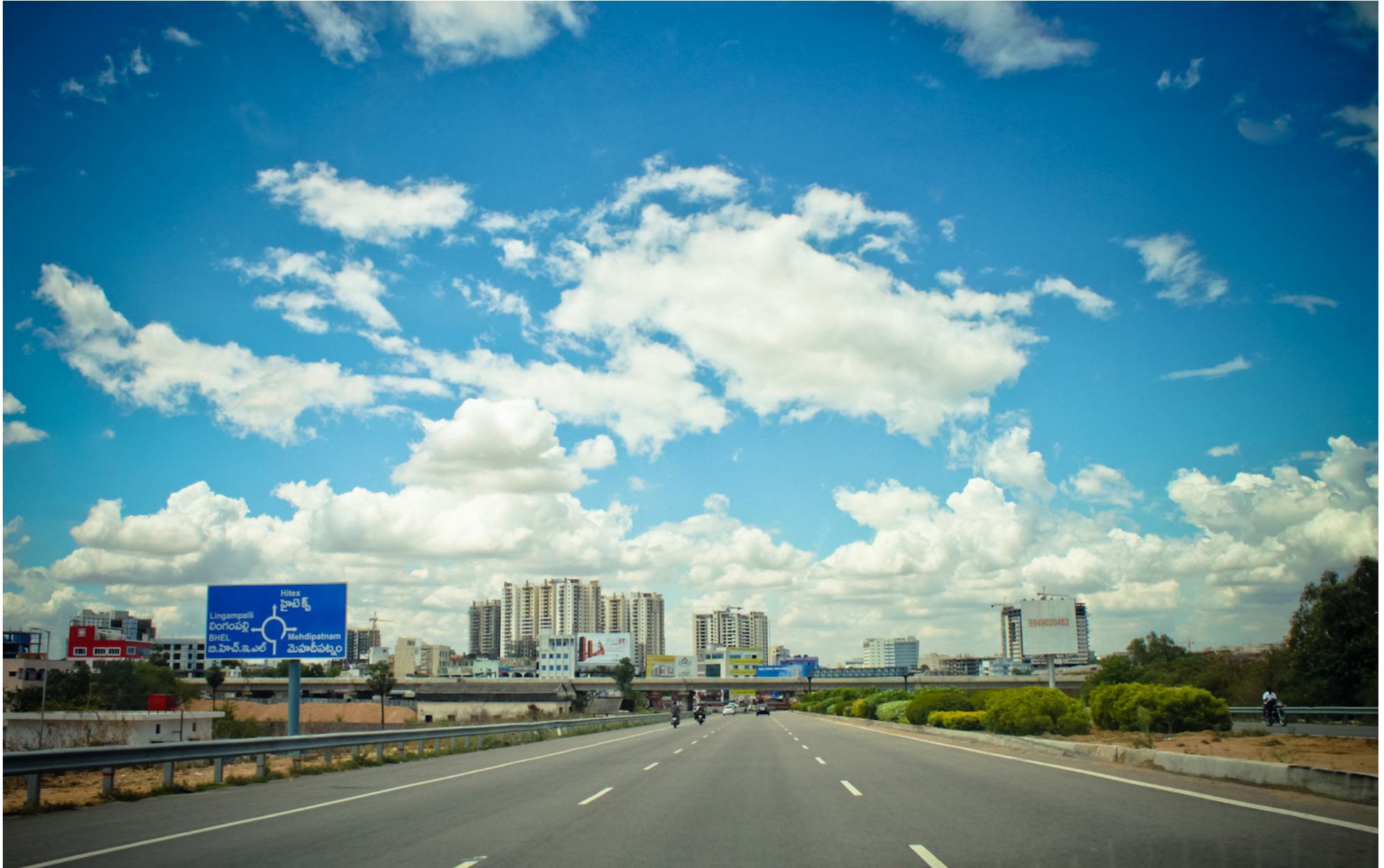
صور المدينة عالية التقنية ومولات التسوق