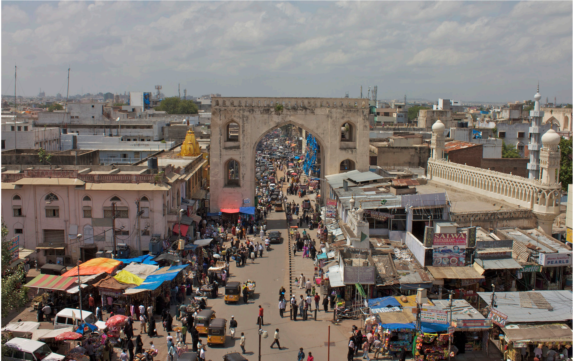
صور المدينة القديمة - حيدر آباد، الهند