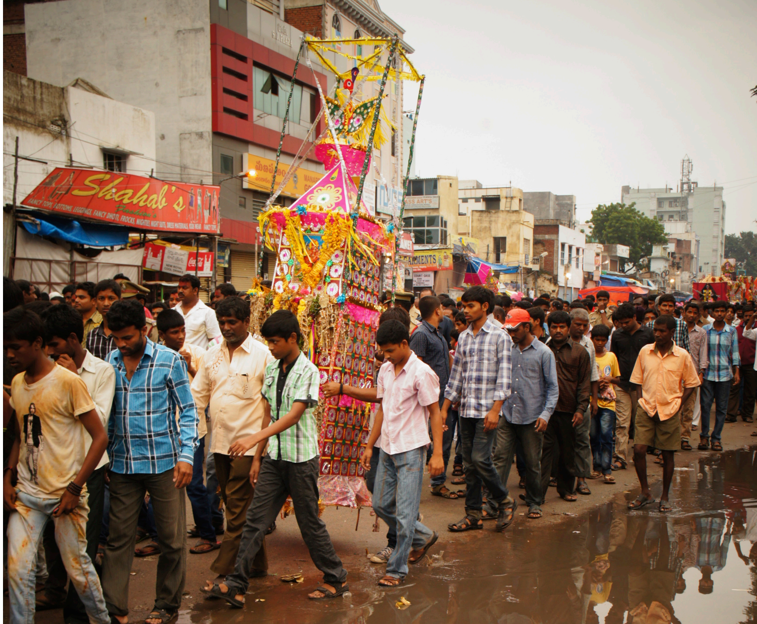
صور المدينة القديمة - حيدر آباد، الهند