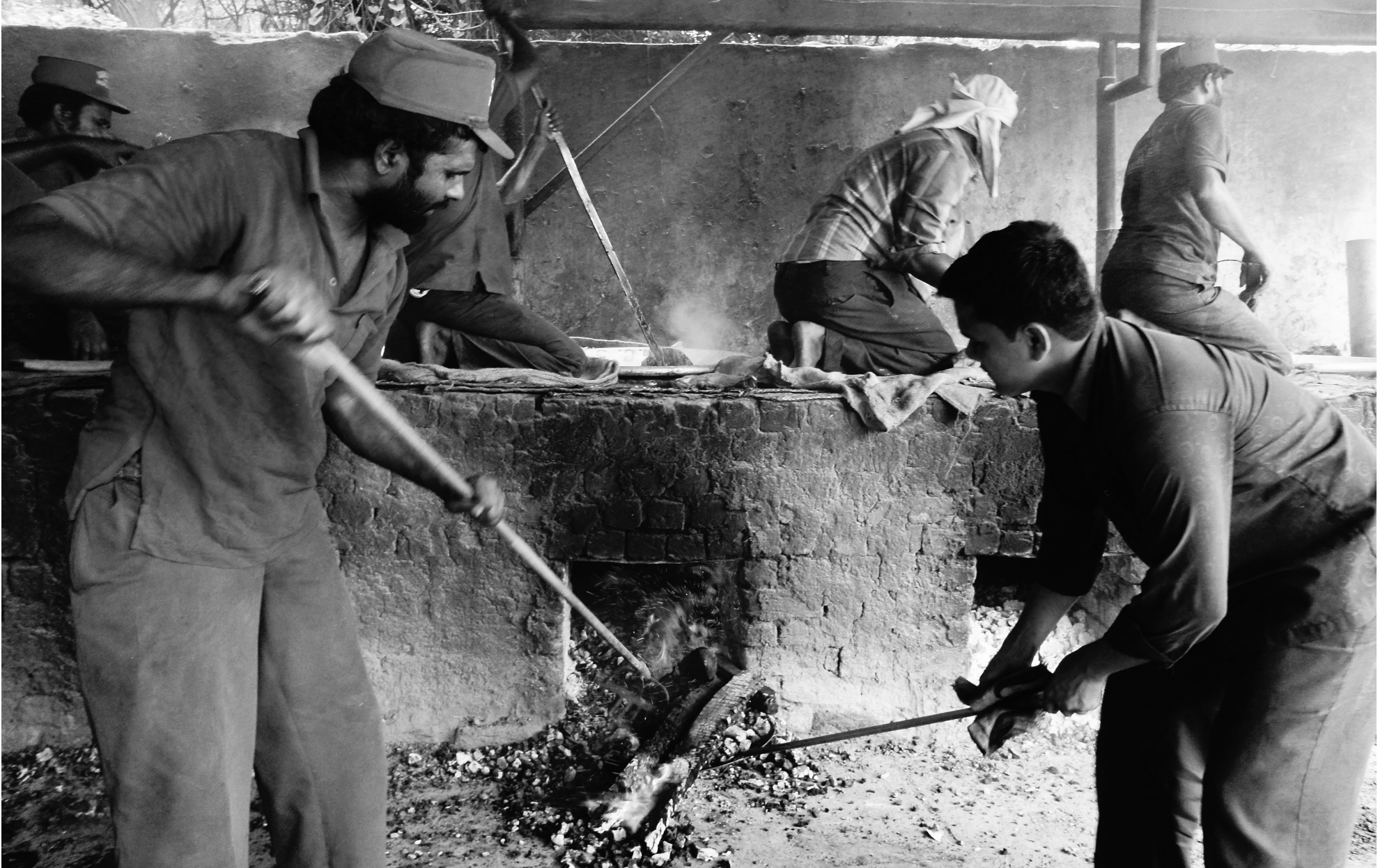
صور المدينة القديمة - حيدر آباد، الهند