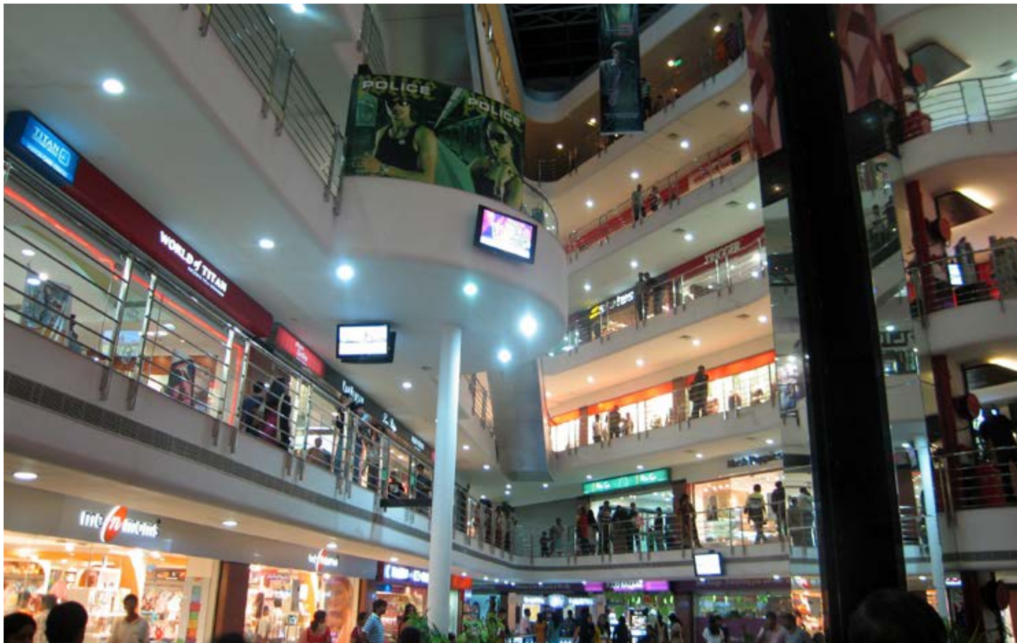
Photos du quartier des affaires et des centres commerciaux