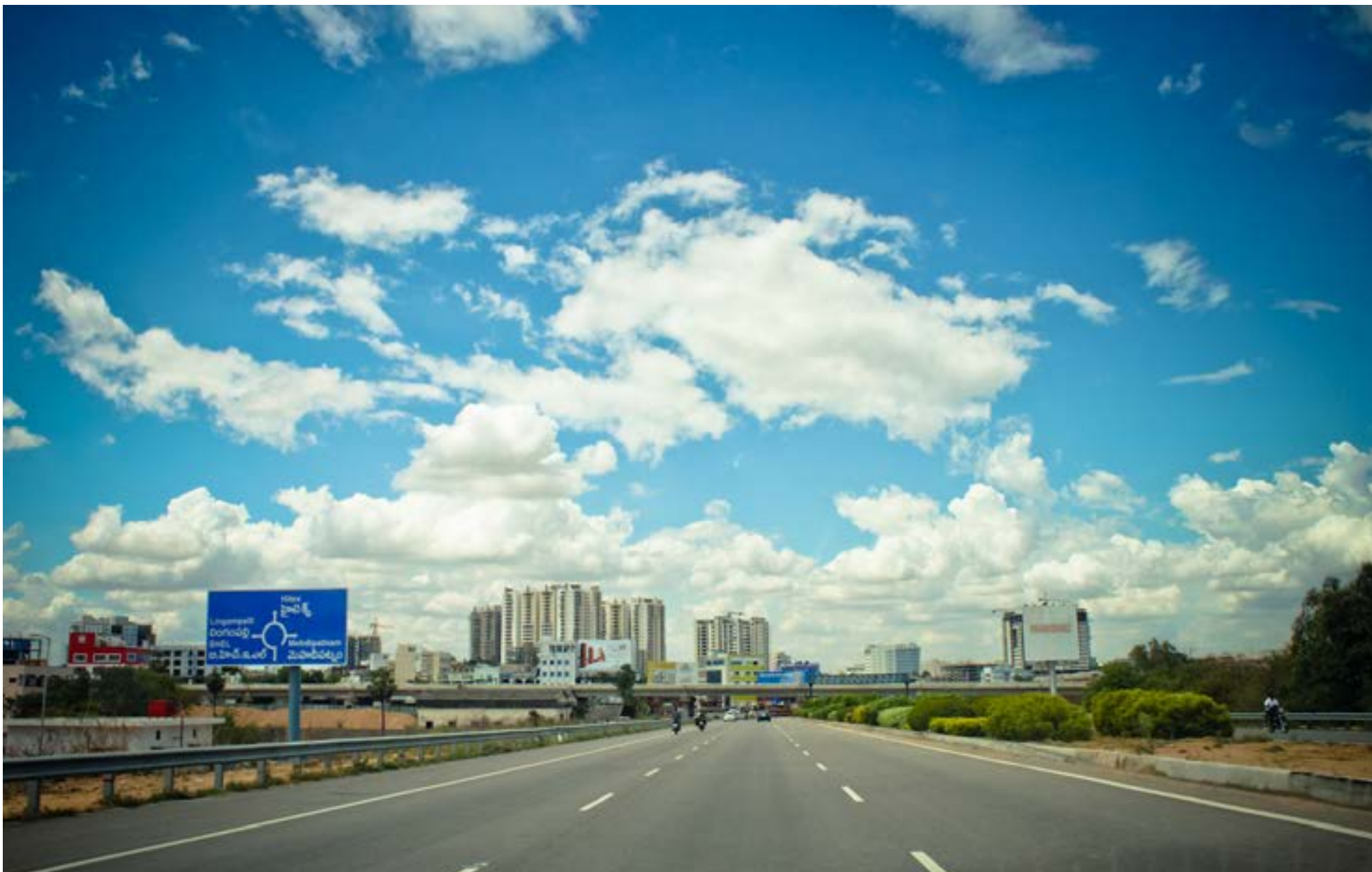
Photos du quartier des affaires et des centres commerciaux