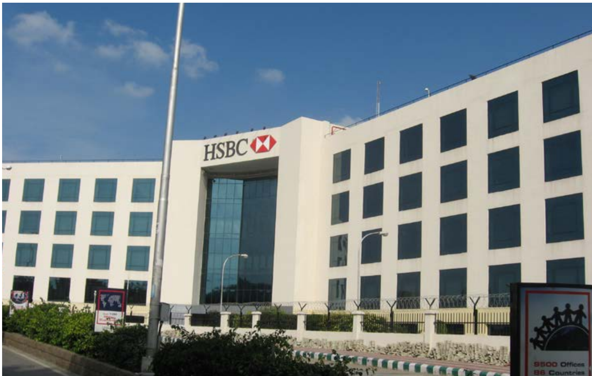
Photos du quartier des affaires et des centres commerciaux

Source : https://www.flickr.com/photos/listenersvision/5782124788